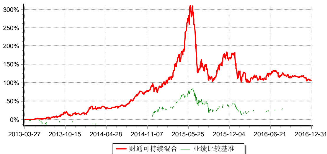
财通可持续发展主题混合型证券投资基金 累计净值增长率与业绩比较基准收益率历史走势对比图 (2013年3月27日-2016年12月31日)