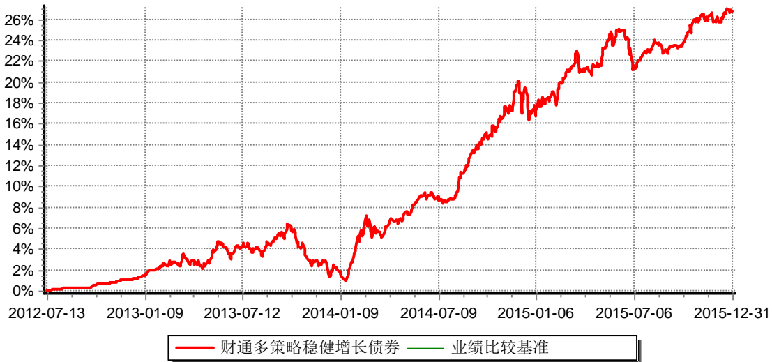
财通多策略稳健增长债券型证券投资基金 累计净值增长率与业绩比较基准收益率历史走势对比图 (2012年7月13日-2015年12月31日)