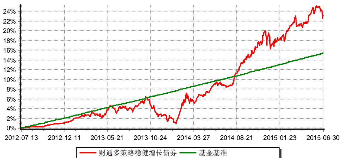
财通多策略稳健增长债券型证券投资基金 累计净值增长率与业绩比较基准收益率历史走势对比图 (2012年7月13日-2015年6月30日)