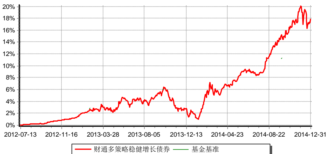
财通多策略稳健增长债券型证券投资基金 累计净值增长率与业绩比较基准收益率历史走势对比图 (2012年7月13日-2014年12月31日)