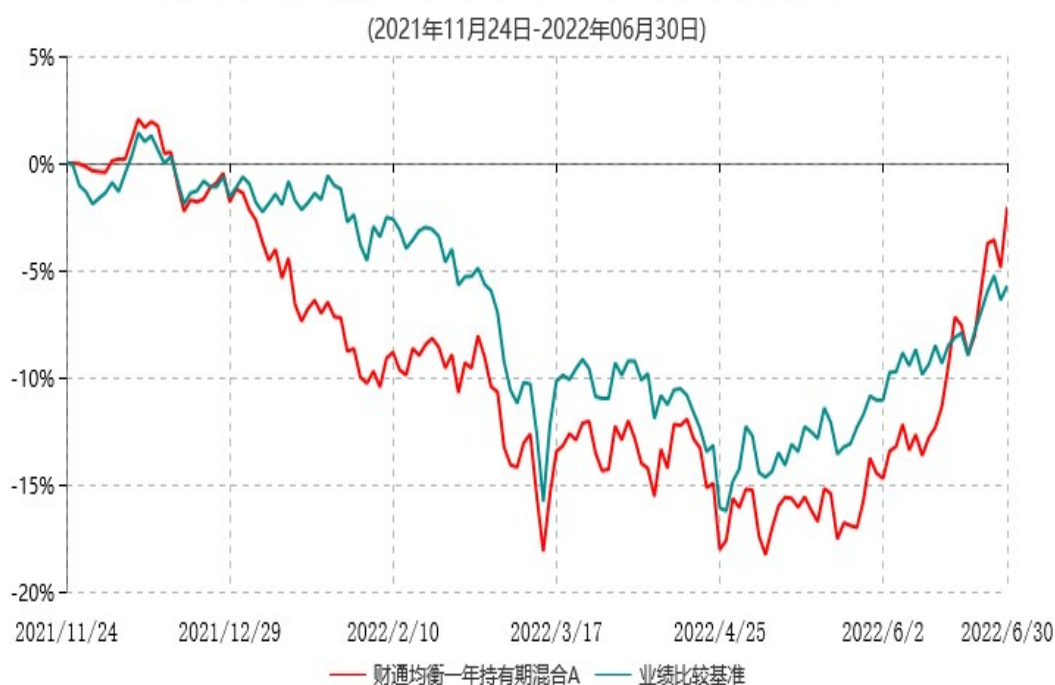
财通均衡一年持有期混合A累计净值增长率与业绩比较基准收益率历史走势对比图