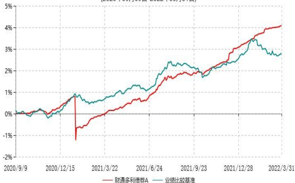
财通多利债券C累计净值增长率与业绩比较基准收益率历史走势对比图