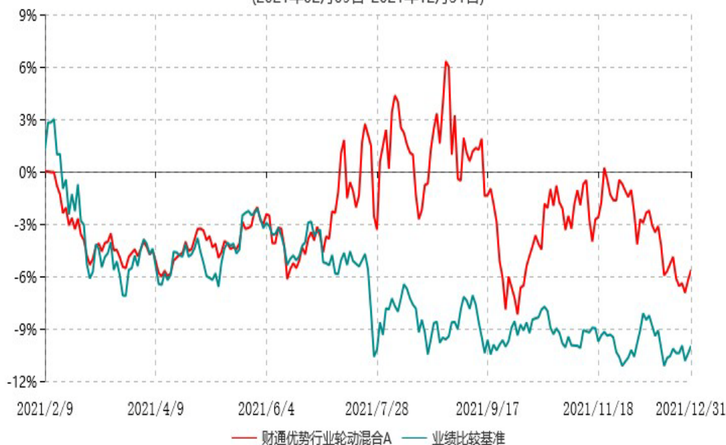
财通优势行业轮动混合C累计净值增长率与业绩比较基准收益率历史走势对比图