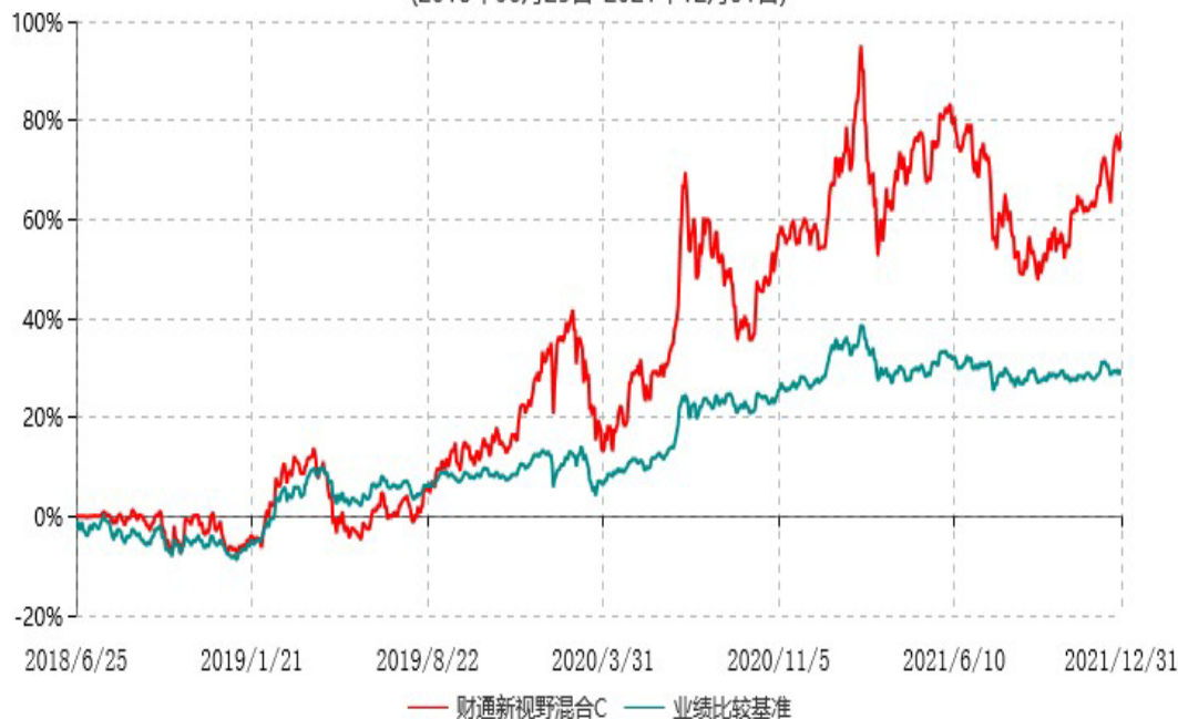
财通新视野混合C累计净值增长率与业绩比较基准收益率历史走势对比图 (2018年06月25日-2021年12月31日)

注：(1)本基金合同生效日为 2018 年 6 月 25 日； (2)本基金建仓期为基金合同生效起 6 个月，截至建仓期末和报告期末，本基金的资产配置符合基金契约的相关要求。