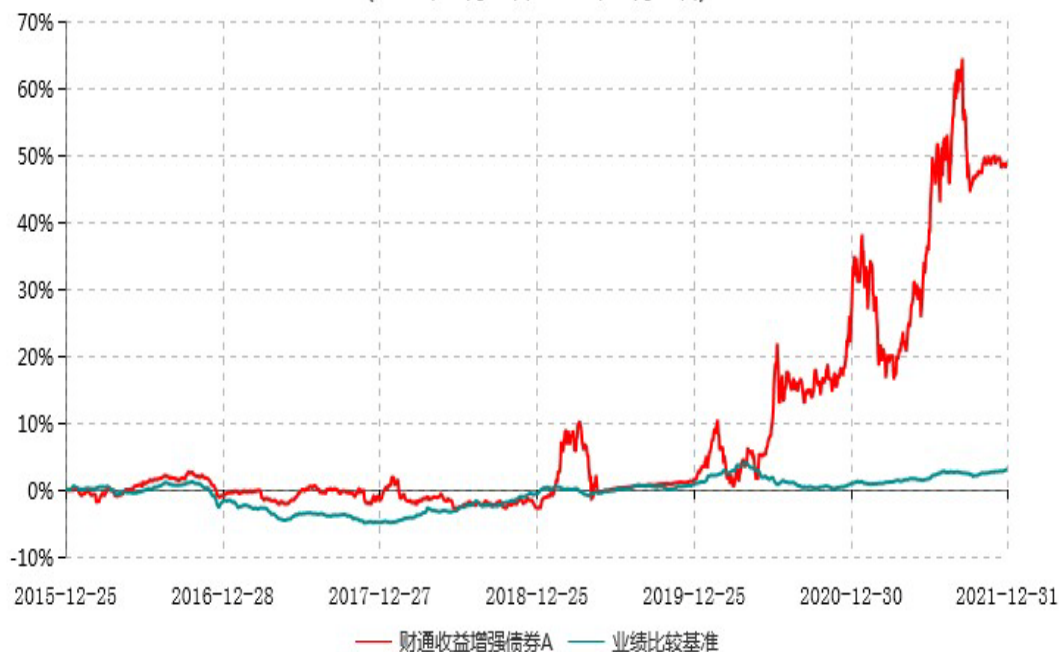
财通收益增强债券A累计净值增长率与业绩比较基准收益率历史走势对比图 (2015年12月25日-2021年12月31日)