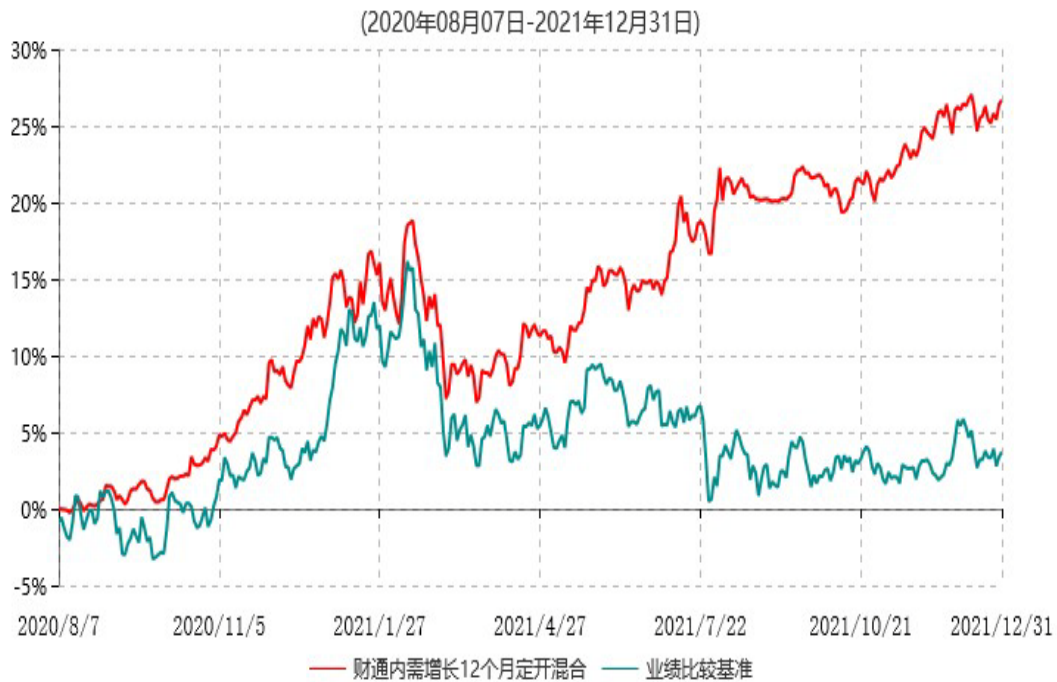
财通内需增长12个月定期开放混合型证券投资基金累计净值增长率与业绩比较基准收益率历史走势对比图