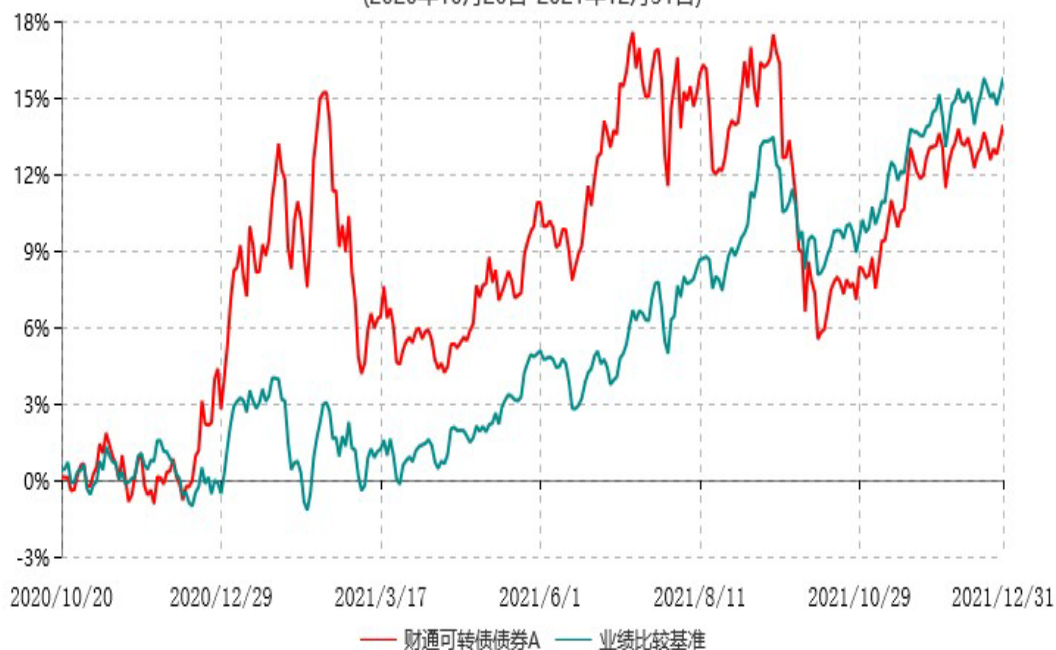
财通可转债债券C累计净值增长率与业绩比较基准收益率历史走势对比图