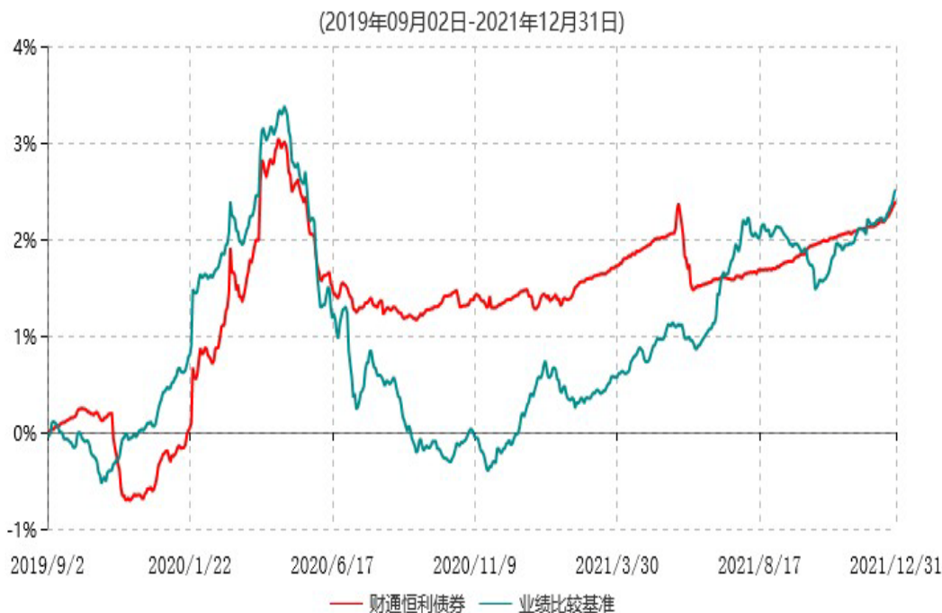
财通恒利纯债债券型证券投资基金累计净值增长率与业绩比较基准收益率历史走势对比图