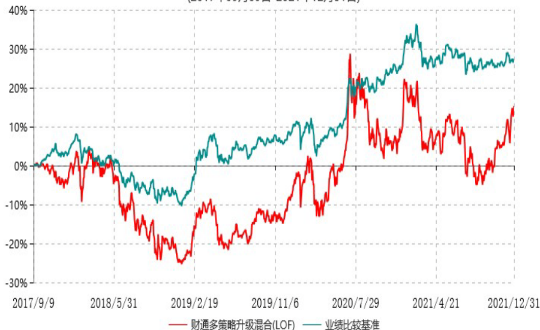
财通多策略升级混合型证券投资基金(LOF)累计净值增长率与业绩比较基准收益率历史走势对比图 (2017年09月09日-2021年12月31日)