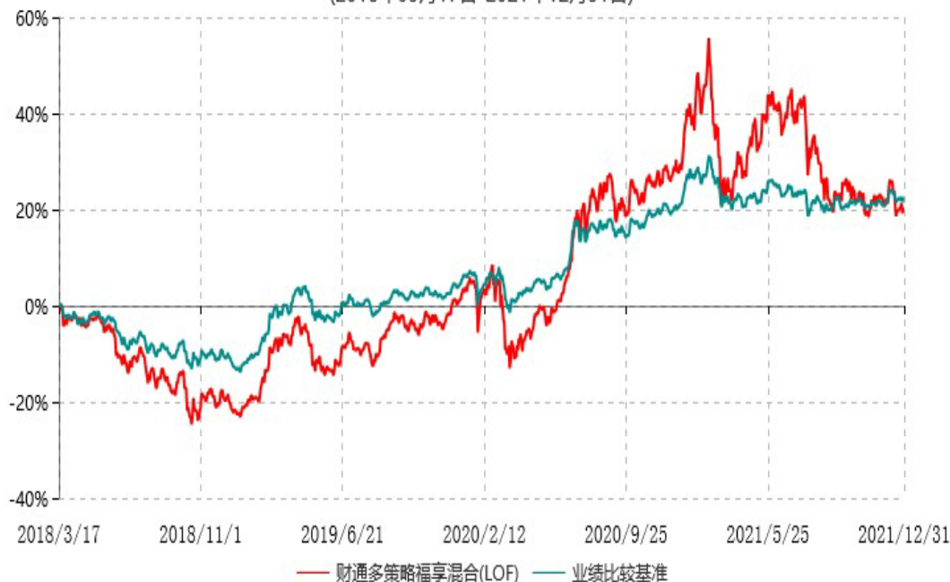
财通多策略福享混合型证券投资基金(LOF)累计净值增长率与业绩比较基准收益率历史走势对比图 (2018年03月17日-2021年12月31日)

注：(1)本基金合同生效日为2016年9月18日，转型日期为2018年3月17日；