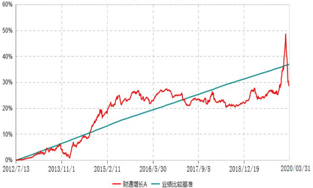
财通增长C累计净值增长率与业绩比较基准收益率历史走势对比图