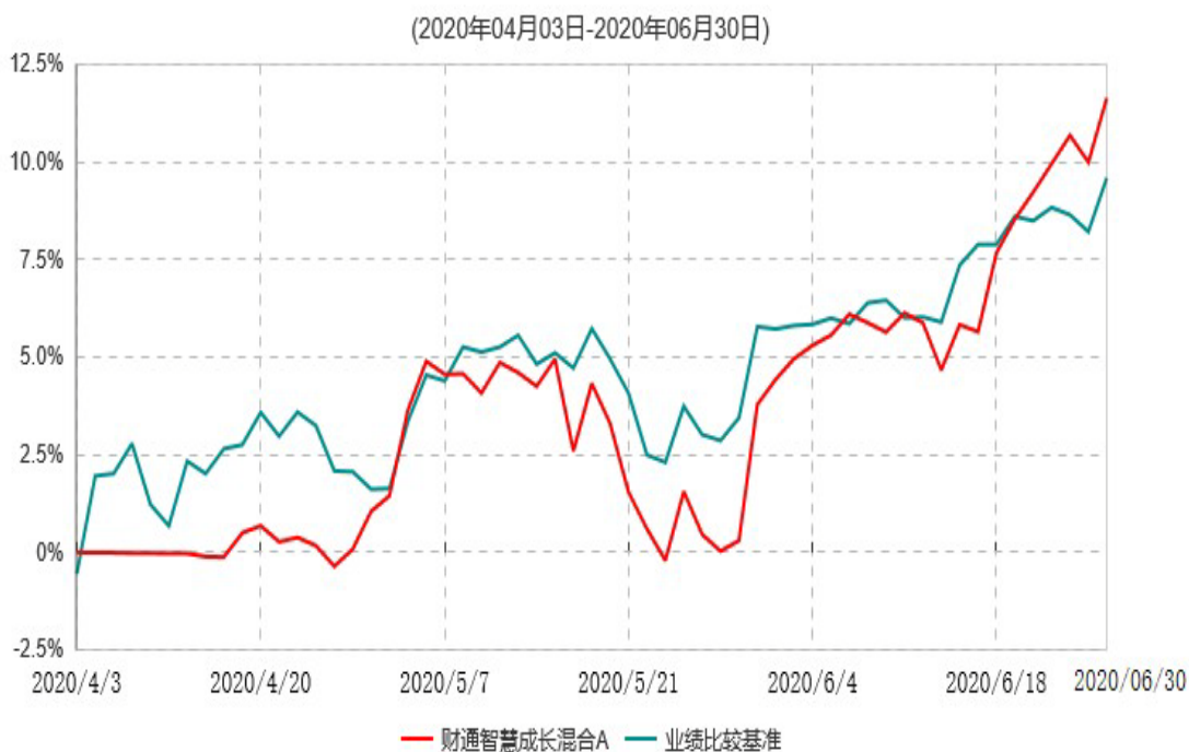
财通智慧成长混合A累计净值增长率与业绩比较基准收益率历史走势对比图