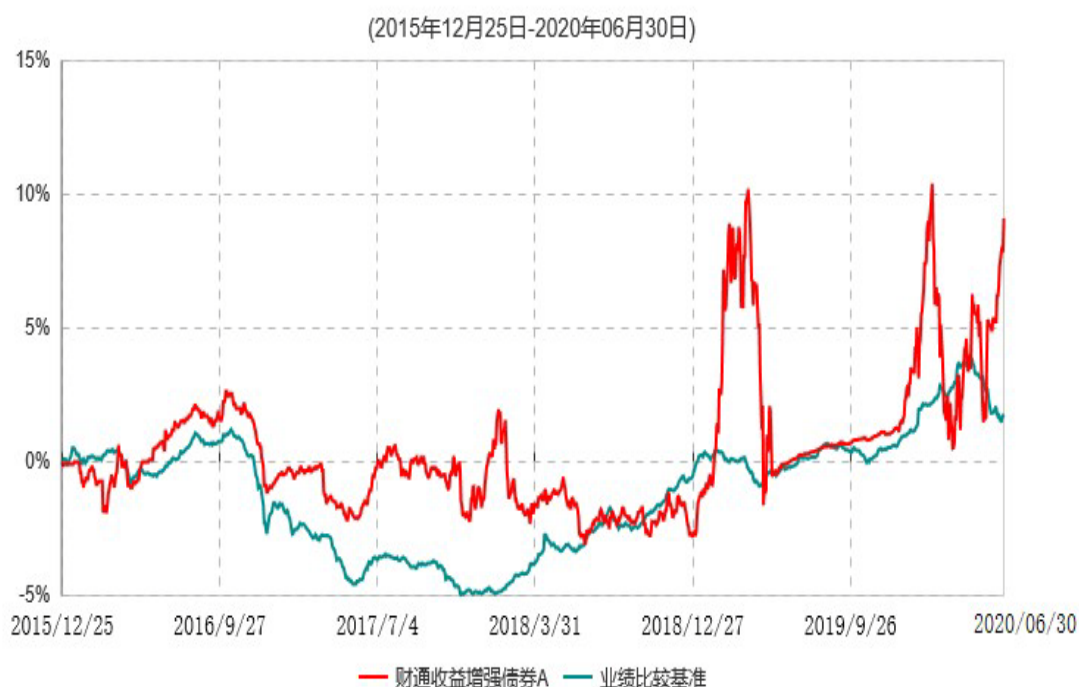
财通收益增强债券A累计净值增长率与业绩比较基准收益率历史走势对比图