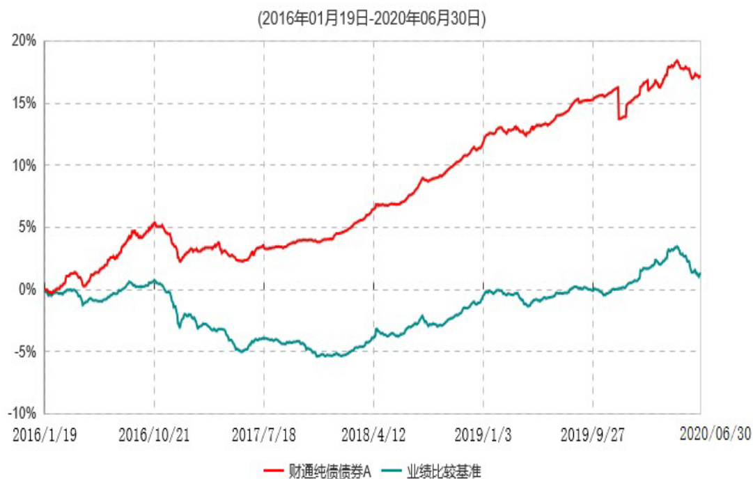
财通纯债债券A累计净值增长率与业绩比较基准收益率历史走势对比图