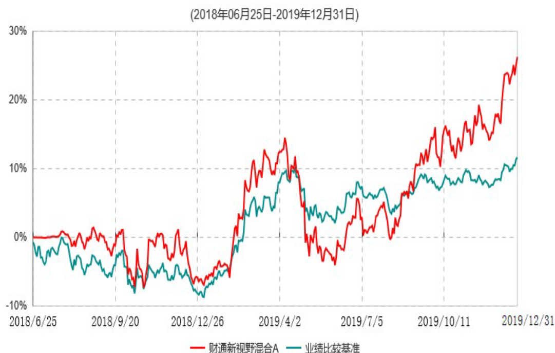
财通新视野混合A累计净值增长率与业绩比较基准收益率历史走势对比图