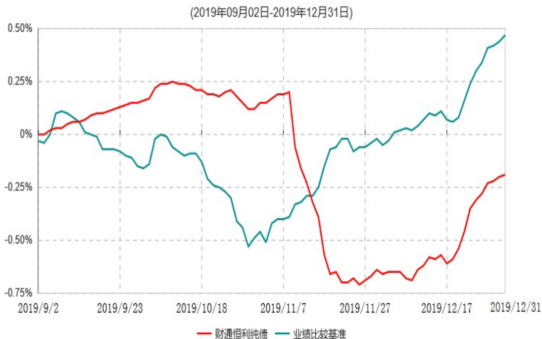
财通恒利纯债债券型证券投资基金累计净值增长率与业绩比较基准收益率历史走势对比图

注：(1)本基金合同生效日为2019年09月02日，基金合同生效起至披露时点不满一年；