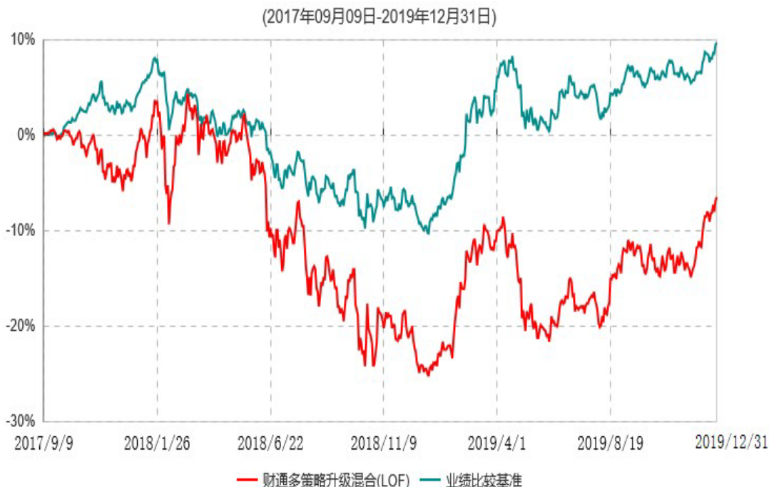
财通多策略升级混合型证券投资基金(LOF)累计净值增长率与业绩比较基准收益率历史走势对比图