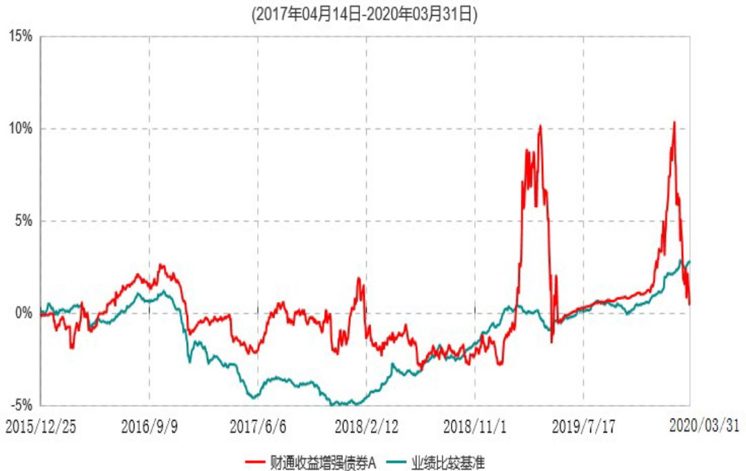
财通收益增强债券A累计净值增长率与业绩比较基准收益率历史走势对比图