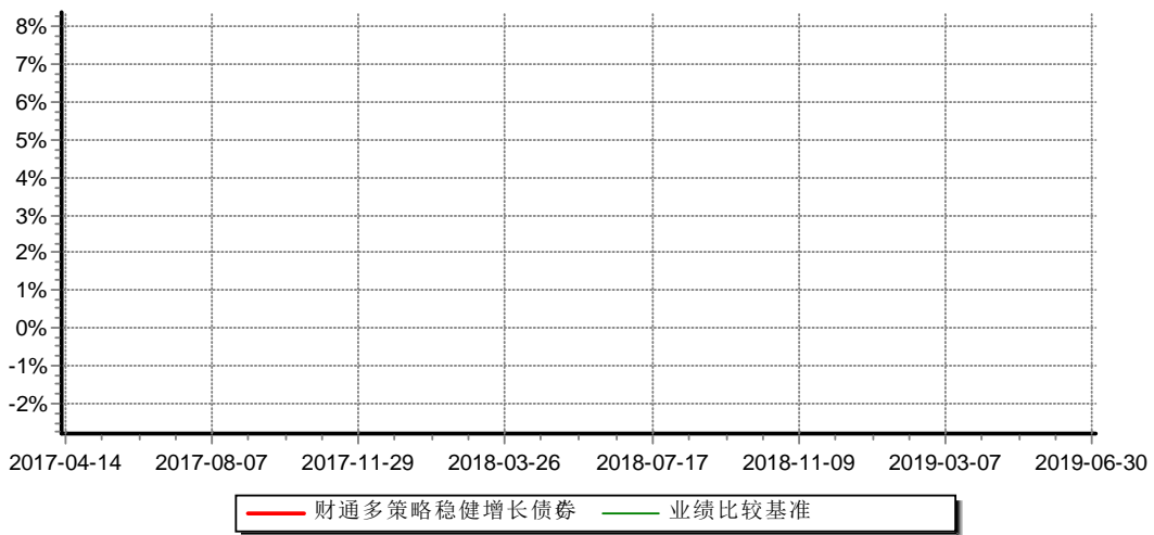
财通多策略稳健增长债券型证券投资基金C 累计净值增长率与业绩比较基准收益率历史走势对比图 (2017年4月14日-2019年6月30日)