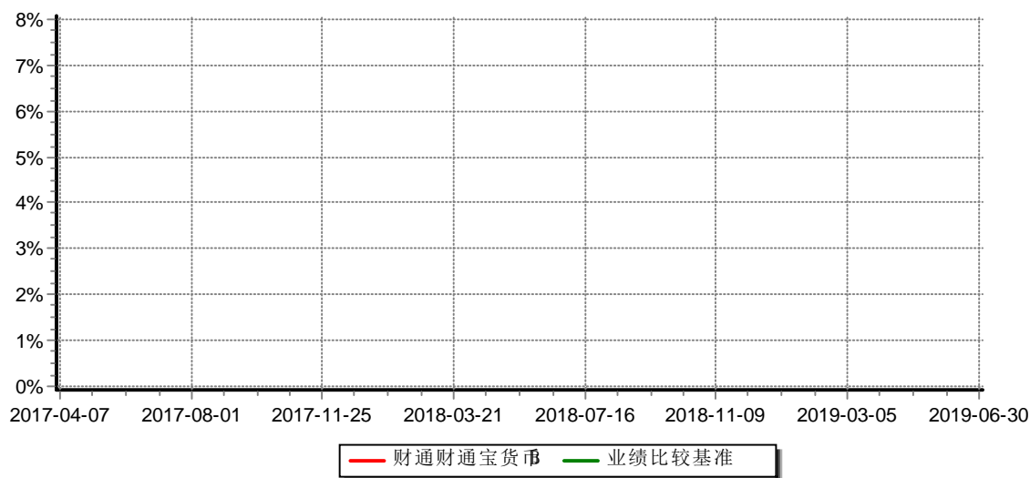
份额累计净值收益率与业绩比较基准收益率历史走势对比图 (2016年07月27日-2019年6月30日)