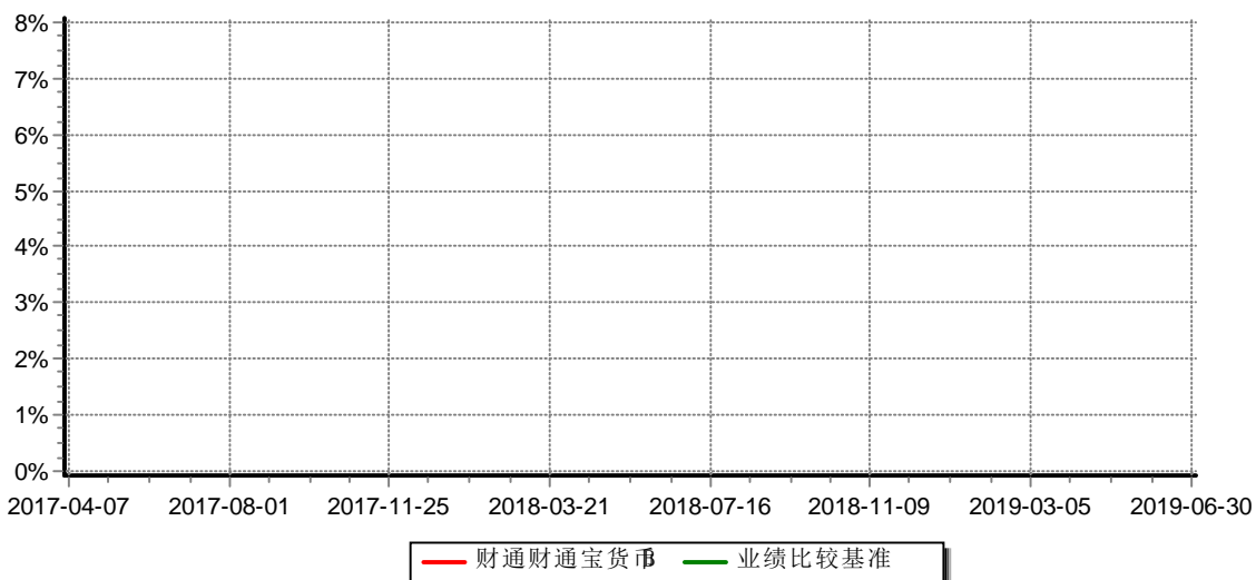
份额累计净值收益率与业绩比较基准收益率历史走势对比图 (2016年07月27日-2019年6月30日)

注：(1)本基金合同生效日为2016年7月27日； (2)本基金建仓期为2016年7月27日至2017年1月17日，截至报告期末及建仓期末，基金的资产配置符合基金契约的相关要求。