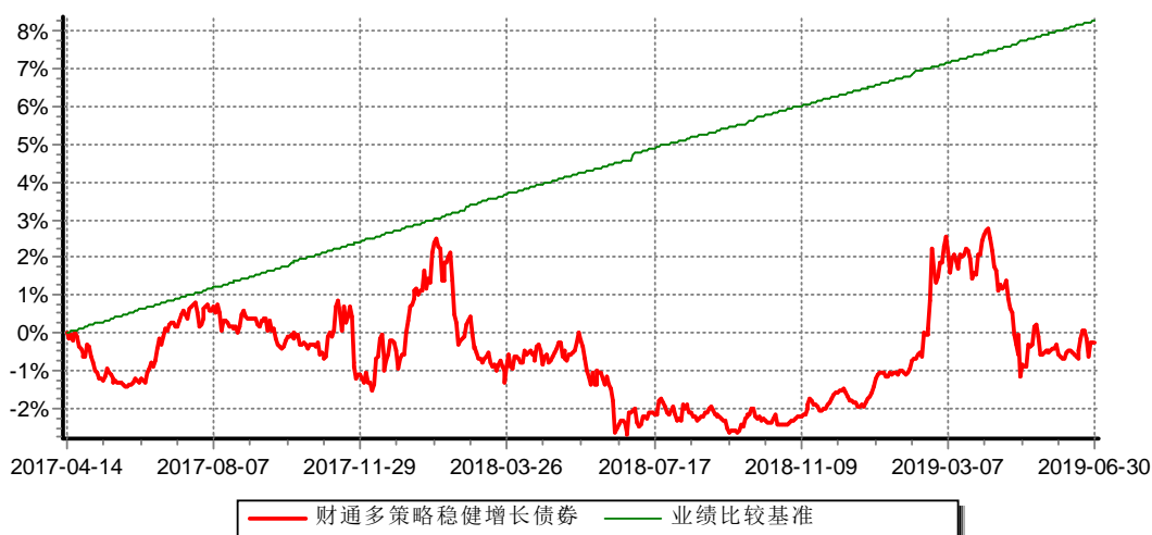
财通多策略稳健增长债券型证券投资基金C 累计净值增长率与业绩比较基准收益率历史走势对比图 (2017年4月14日-2019年6月30日)

(4)本基金自2017年4月14日起增设收取销售服务费的C类份额，原份额变更为A类份额。