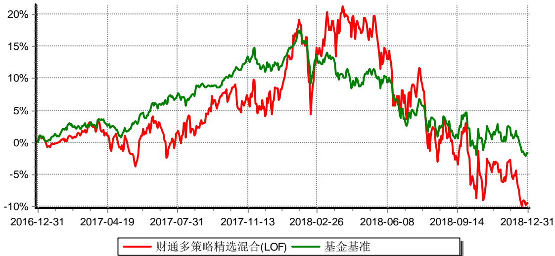
财通多策略精选混合型证券投资基金(LOF) 累计净值增长率与业绩比较基准收益率历史走势对比图 (2016年12月31日-2018年12月31日)

注: (1)本基金合同生效日为2015年7月1日,转型日期为2016年12月31日;