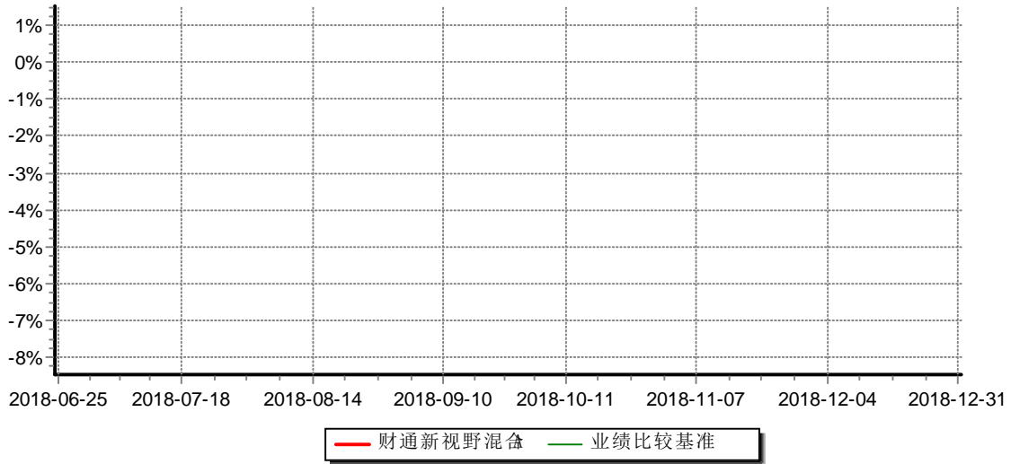
财通新视野灵活配置混合型证券投资基金C 累计净值增长率与业绩比较基准收益率历史走势对比图 (2018年06月25日-2018年12月31日)