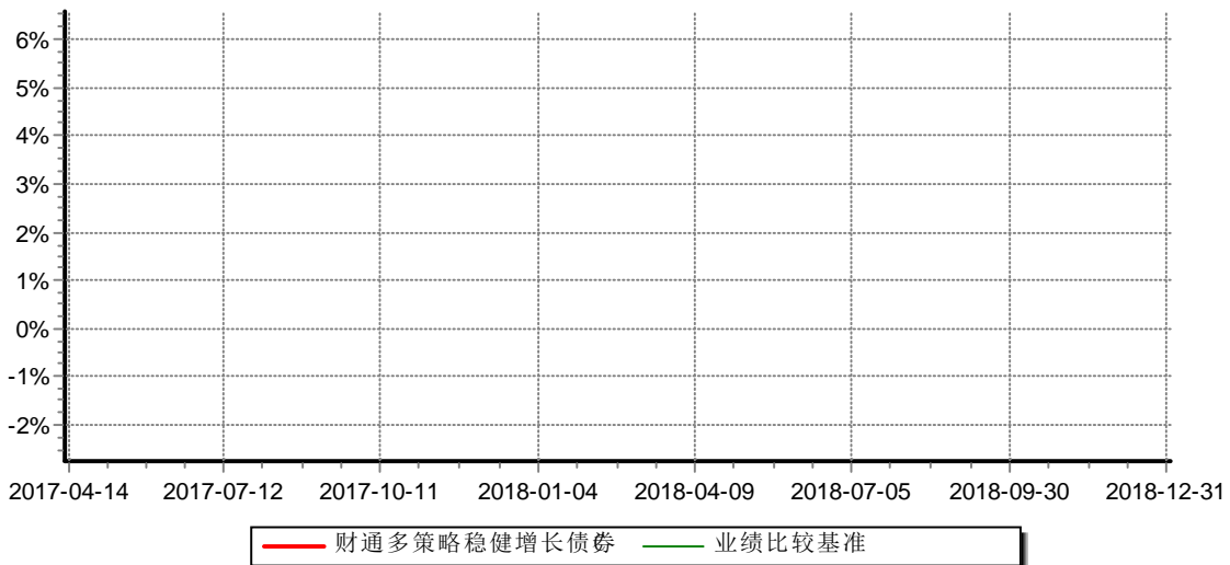
财通多策略稳健增长债券型证券投资基金C 累计净值增长率与业绩比较基准收益率历史走势对比图 (2017年4月14日-2018年12月31日)

(4) 本基金自2017年4月14日起增设收取销售服务费的C类份额，原份额变更为A类份额。