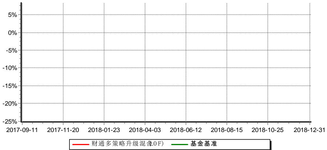
财通多策略升级混合型证券投资基金(LOF) 累计净值增长率与业绩比较基准收益率历史走势对比图 (2017年9月9日-2018年12月31日)