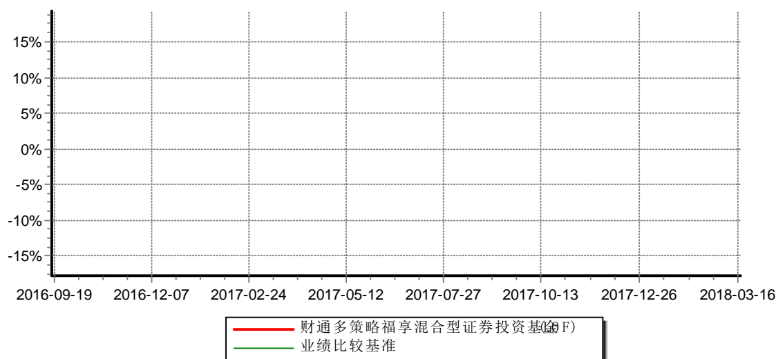
财通多策略福享混合型证券投资基金 累计净值增长率与业绩比较基准收益率历史走势对比图 (2016年9月18日-2018年3月16日)