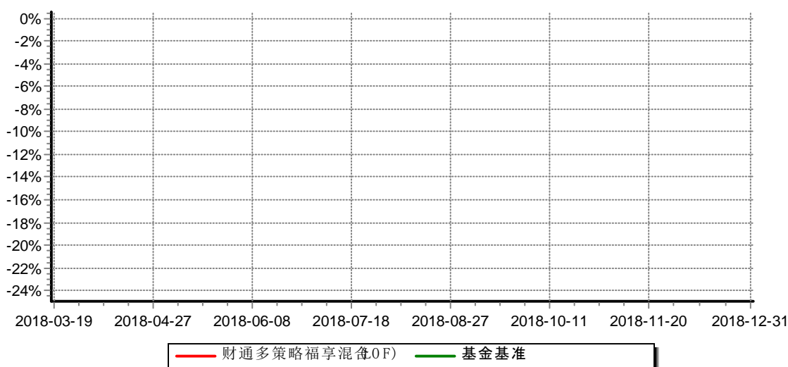
财通多策略福享混合型证券投资基金(LOF) 累计净值增长率与业绩比较基准收益率历史走势对比图 (2018年3月17日-2018年12月31日)

注：(1)本基金合同生效日为2016年9月18日，转型日期为2018年3月17日，基金转型至披露时点不满一年；