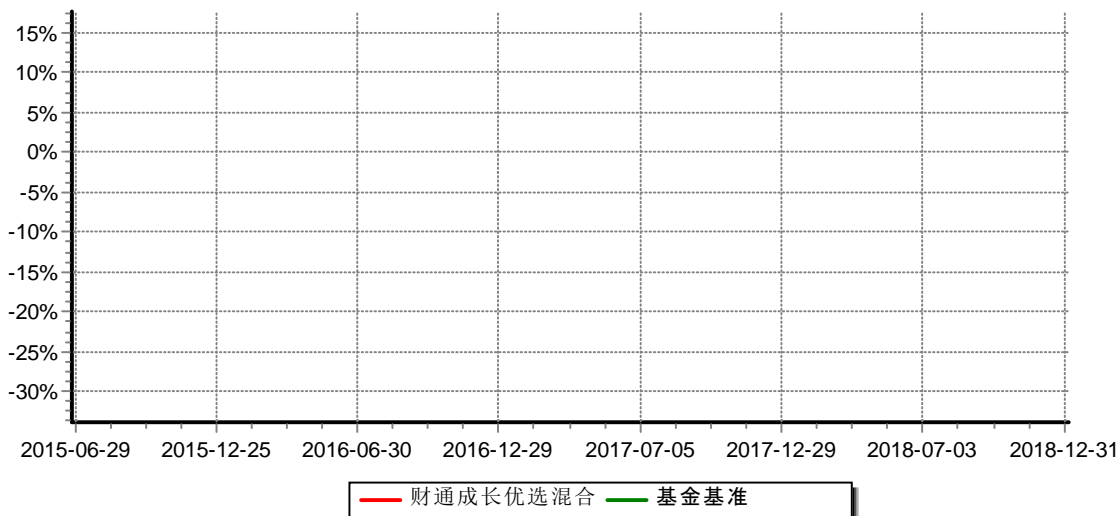
财通成长优选混合型证券投资基金 累计净值增长率与业绩比较基准收益率历史走势对比图 (2015年6月29日-2018年12月31日)