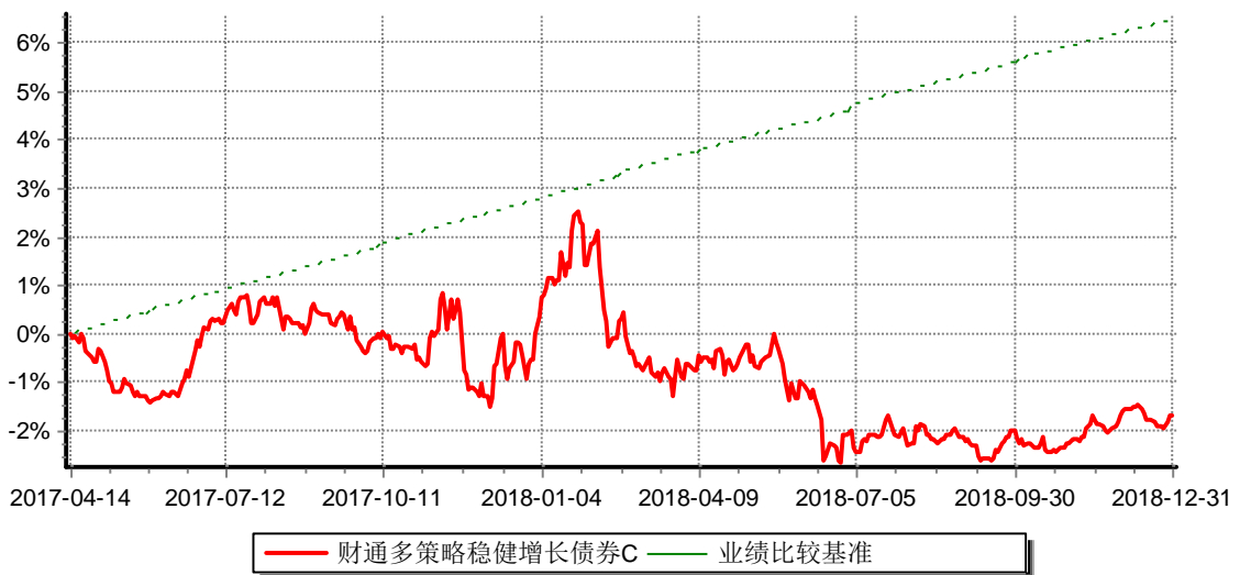
财通多策略稳健增长债券型证券投资基金C 累计净值增长率与业绩比较基准收益率历史走势对比图 (2017年4月14日-2018年12月31日)