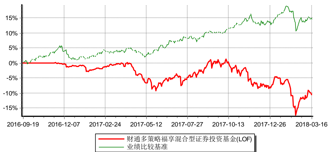
财通多策略福享混合型证券投资基金 累计净值增长率与业绩比较基准收益率历史走势对比图 (2016年9月18日-2018年3月16日)