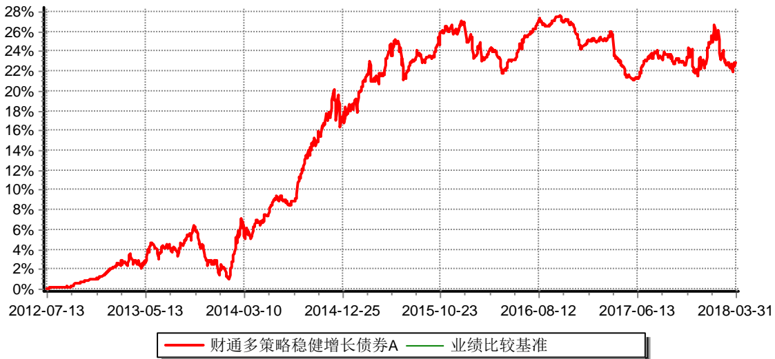
财通多策略稳健增长债券型证券投资基金A 累计净值增长率与业绩比较基准收益率历史走势对比图 (2012年7月13日-2018年3月31日)