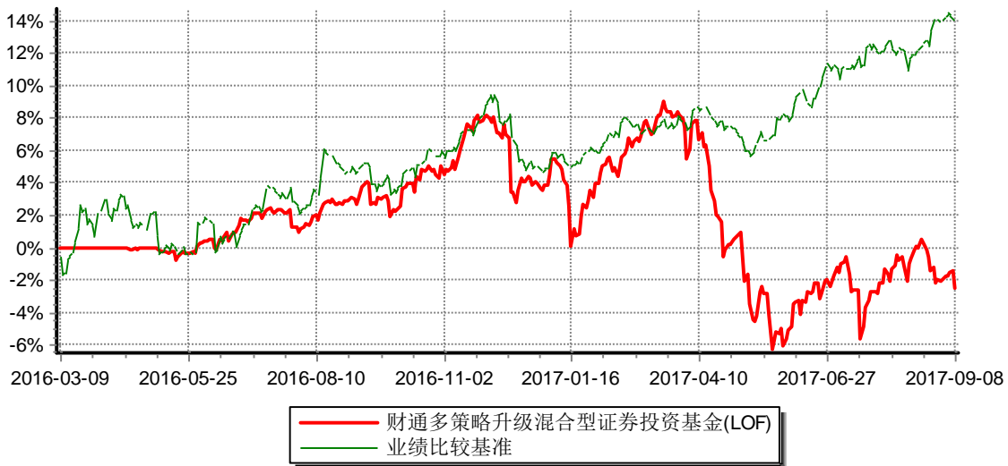
财通多策略升级混合型证券投资基金 累计净值增长率与业绩比较基准收益率历史走势对比图 (2016年3月9日-2017年9月8日)

注：(1)本基金合同生效日为2016年3月9日,本基金的封闭期于2017年9月8日结束，于2017年9月9日起转换为上市开放式基金（LOF）。