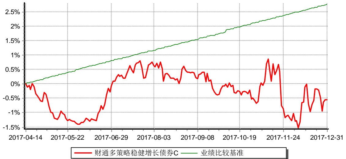
财通多策略稳健增长债券型证券投资基金C 累计净值增长率与业绩比较基准收益率历史走势对比图 (2017年4月14日-2017年12月31日)