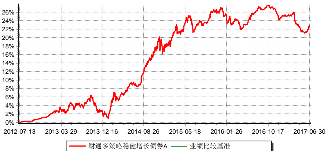
财通多策略稳健增长债券型证券投资基金A 累计净值增长率与业绩比较基准收益率历史走势对比图 (2012年7月13日-2017年6月30日)