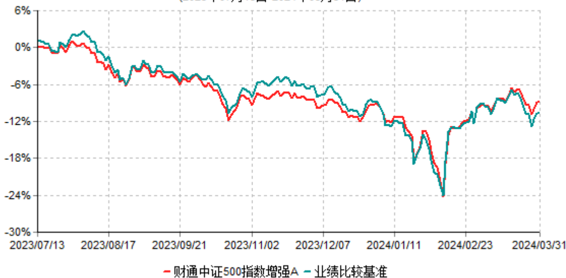
财通中证500指数增强A累计净值增长率与业绩比较基准收益率历史走势对比图 (2023年07月13日-2024年03月31日)