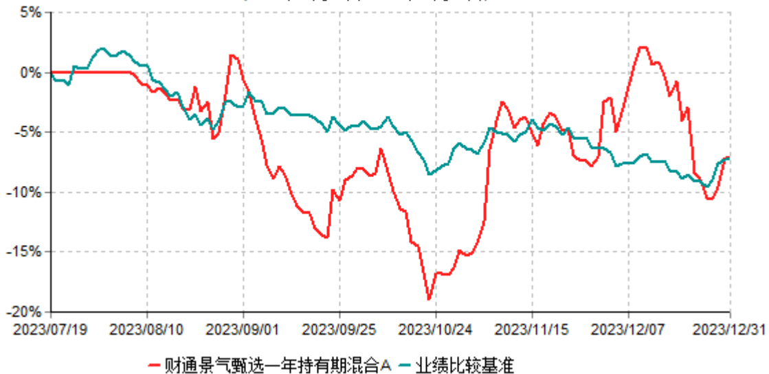
财通景气甄选一年持有期混合A累计净值增长率与业绩比较基准收益率历史走势对比图 (2023年07月19日-2023年12月31日)