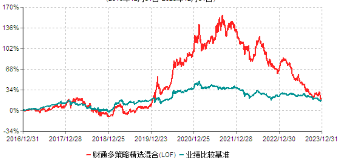
财通多策略精选混合型证券投资基金(LOF)累计净值增长率与业绩比较基准收益率历史走势对比图 (2016年12月31日-2023年12月31日)

注：(1)本基金合同生效日为2015年7月1日，转型日期为2016年12月31日； (2)本基金建仓期为基金合同生效起6个月，截至建仓期末与本报告期内，本基金的资产配置符合基金契约的相关要求。