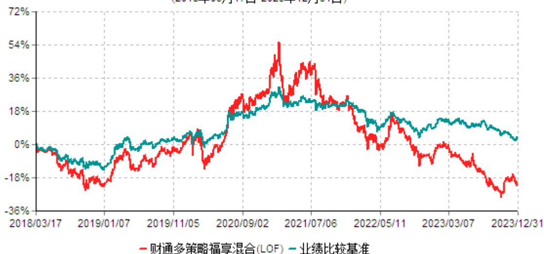
财通多策略福享混合型证券投资基金（LOF）累计净值增长率与业绩比较基准收益率历史走势对比图 (2018年03月17日-2023年12月31日)

注：(1)本基金合同生效日为2016年9月18日，转型日期为2018年3月17日； (2)本基金建仓期为基金合同生效起6个月，截至报告期末和基金建仓期末，基金的资产配置符合基金契约的相关要求。