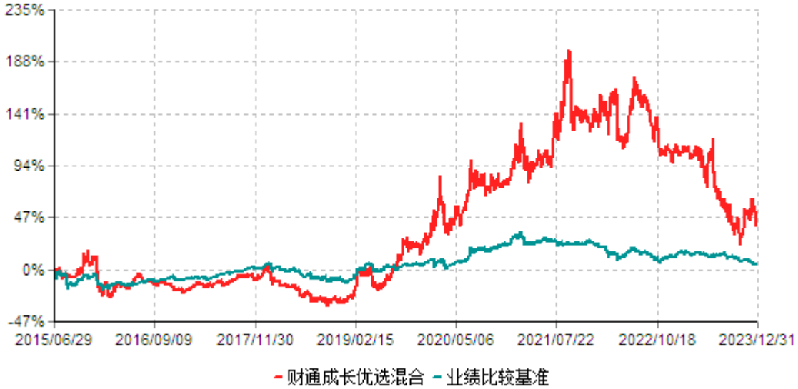
财通成长优选混合型证券投资基金累计净值增长率与业绩比较基准收益率历史走势对比图 (2015年06月29日-2023年12月31日)

注：(1)本基金合同生效日为2015年6月29日； (2)本基金建仓期为基金合同生效起6个月，截至建仓期末及本报告期末，本基金的资产配置符合基金契约的相关要求。