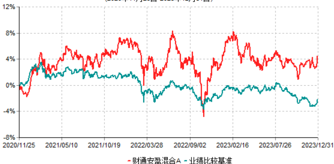
财通安盈混合A累计净值增长率与业绩比较基准收益率历史走势对比图 (2020年11月25日-2023年12月31日)