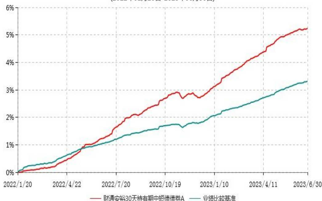
财通安裕30天持有期中短债债券A累计净值增长率与业绩比较基准收益率历史走势对比图 (2022年01月20日-2023年06月30日)