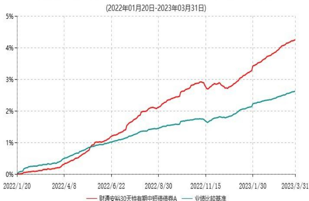
财通安裕30天持有期中短债债券A累计净值增长率与业绩比较基准收益率历史走势对比图