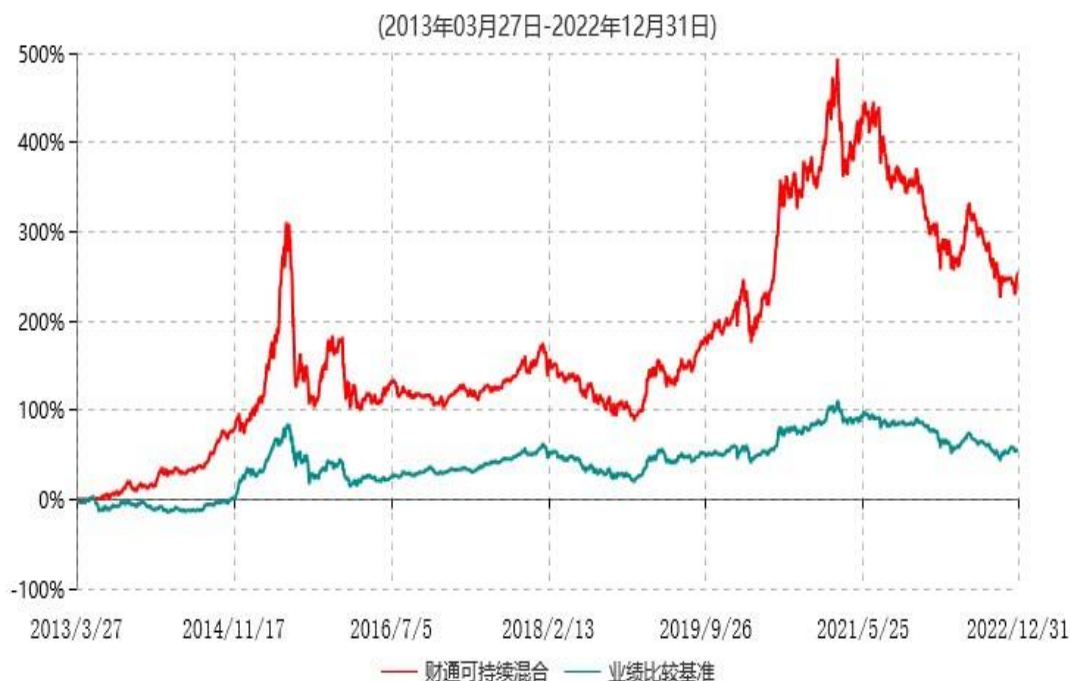
财通可持续发展主题混合型证券投资基金累计净值增长率与业绩比较基准收益率历史走势对比图