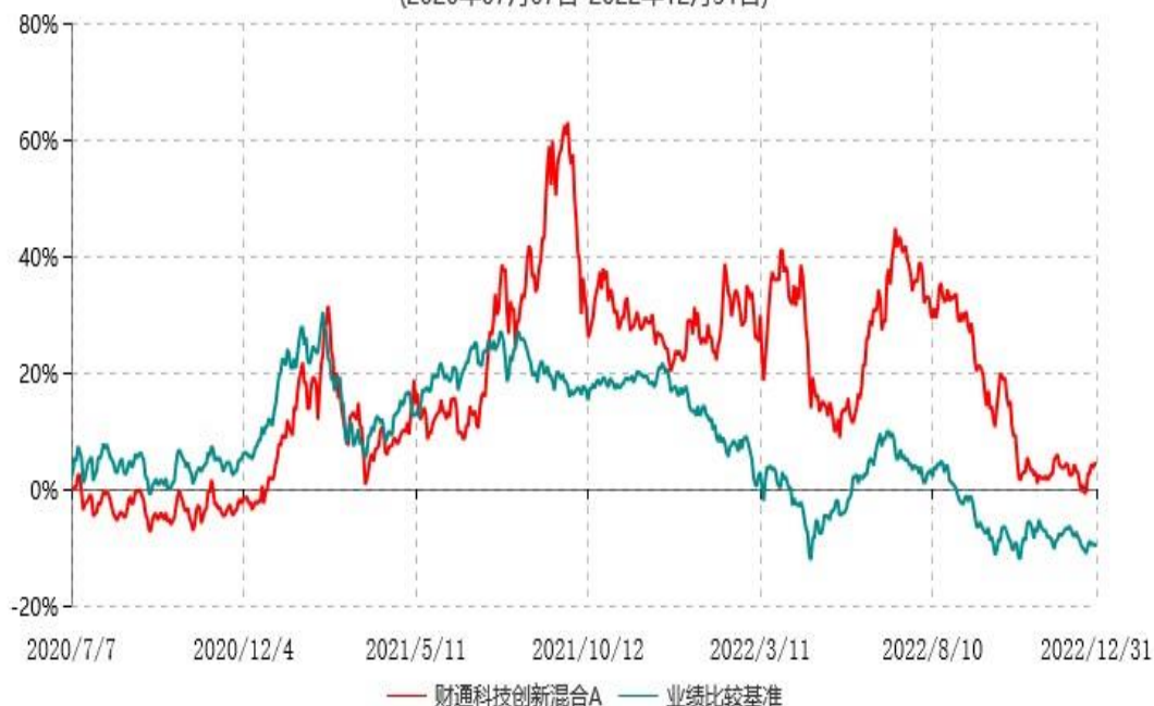
财通科技创新混合C累计净值增长率与业绩比较基准收益率历史走势对比图