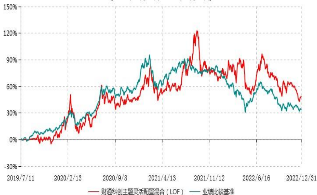
财通科创主题灵活配置混合型证券投资基金（LOF）累计净值增长率与业绩比较基准收益率历史走势对比图 (2019年07月11日-2022年12月31日)