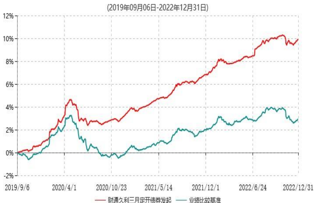
财通久利三个月定期开放债券型发起式证券投资基金累计净值增长率与业绩比较基准收益率历史走势对比图